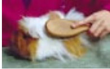
Meerschweinchen – ein beliebter Vierbeiner