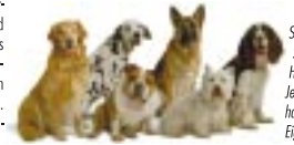
Schaf-, Schutz- und Hirtenhunde: Jede Rasse hat besondere Eigenschaften.