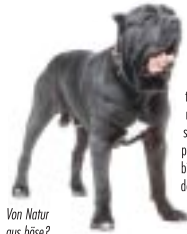
Von Natur aus böse?

Aggressive Pitbulls fielen im Hamburger Tierheim über ihre Pfleger her und verletzten sie schwer. Der Leiter des Tierheims sah keine andere Möglichkeit, als die Tiere einschlafen zu lassen, denn „man kann nie sicher sein, wie sie reagieren“. Fast jede Woche sind solche und ähnliche Meldungen über aggressive Hunde in den Zeitungen zu lesen. Bei manchen Tieren helfen selbst intensive Therapien durch Hundebilder nicht mehr. Kenner der Hunde wissen jedoch: Von House aus sind Hunde wie Dobermann, Staffordshire, Mastino oder Pitbull keineswegs aggressiver als andere Artgenossen. Viele Hundefreunde halten sie als Familienhund. Für Hundexperten sind sie deshalb genau so normale Hunde wie andere auch. Und sie betonen dabei immer wieder: Der Hund, egal welcher Rasse und Herkunft, verhält sich so, wie er von seinem „Rudel-führer Mensch“ erzogen und geprägt wird.