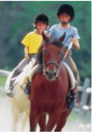
Spaß und Sport im Sattel: Reiten als Hobby oder medizinische Therapie

Um die Balance zu halten, muss der Patient ständig zwischen Anspannung und Lockerung seiner Rückenmuskeln wechseln. Die Therapie fördert damit so wohl das Bewegungsempfinden als auch den Gleichgewichtssinn.